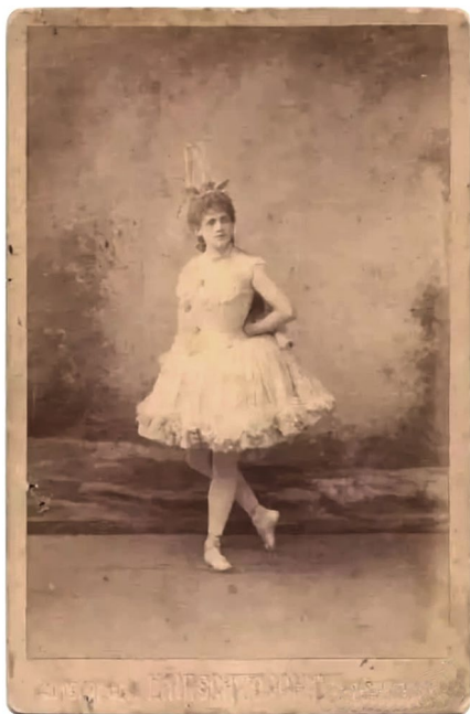
Илл. 1. Балерина Е. К. Обухова. [13]

являлась носительницей академического стиля русского балета. Ее педагогический стиль вообрал почерк учителей и работавших с ней балетмейстеров. Благодаря приезду Е. К. Обуховой в Ташкент несколько поколений узбекских воспитанников были обучены и приобщены к петербургской исполнительской культуре, к традициям Императорской балетной сцены. «Биография узбекского балета могла уложиться в четверть века только потому, что русский балет складывался дольше в десять раз. Выверенность “школы”, утвердившееся кредо реализма, глубокое понимание зрителя, любовь народа к искусству, сформировали выдающихся мастеров русского балета, которые понесли по свету это русское