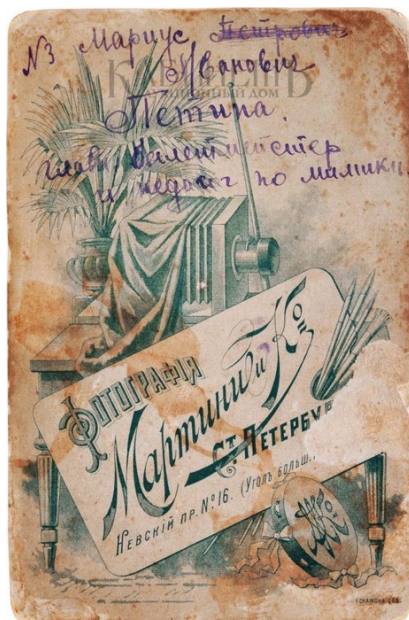
Фото Мариуса Ивановича Петипа с дарственной надписью к Е. К. Обуховой (оборотная сторона)